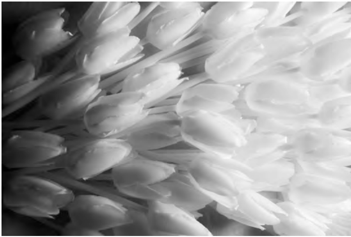
Mona Oren, Wax Tulip Mania, 2020 Tulipes de cire blanche