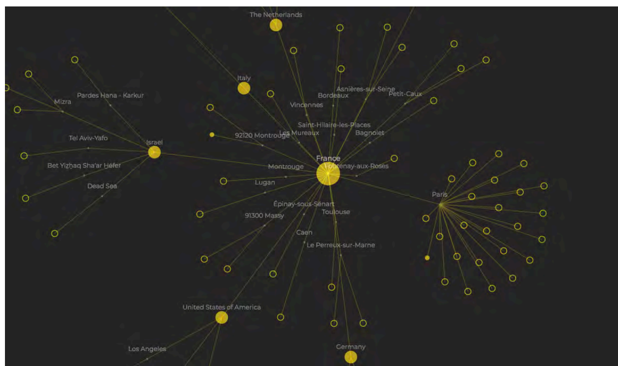
Mona Oren, Wax Tulip Mania , 2020 Champs de Tulipes à travers le monde

À partir de cette collection de photographies et des informations de localisation, se dessine la carte d'un champ virtuel qui prend toute sa dimension sur la toile. L'image flottante d'une constellation de points reliés entre eux, aux allures d'akènes plumeux, caractéristique d'un pissenlit fragile, près à s'envoler d'un souffle.